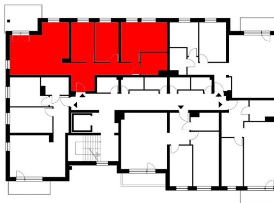
USYTUOWANIE MIESZKANIA W BUDYNKU