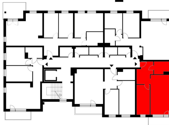
USYTUOWANIE MIESZKANIA W BUDYNKU